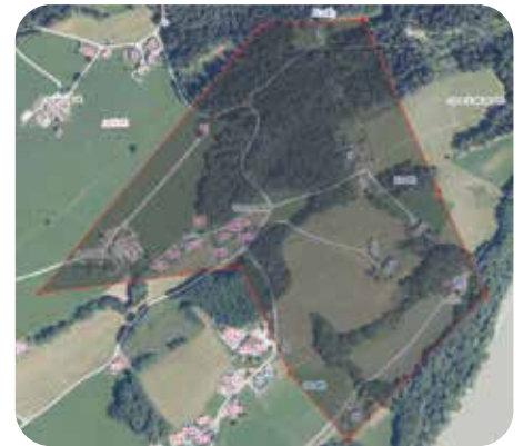
Haushalte in Ortsteilen Achleit/Kreith, die bereits am 30 April besucht werden