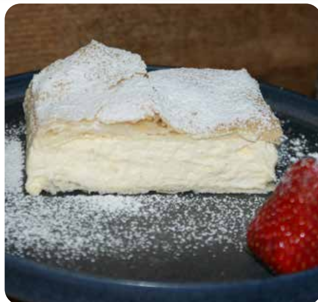
Rezept und Foto: Ing. Judith (Marlene) Horngacher, Schaufler

Ich schneide die Blätterteigplatte für den Deckel bereits vor dem Zusammensetzen in kleine Würfel. So lässt sich die Cremeschnitte später leichter schneiden und portionieren, ohne dass die Creme herausgedrückt wird. Gutes Gelingen und guten Appetit!