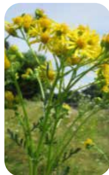
Wassergreiskraut und Jakobsgreiskraut (heimisch)

haft frei halten würde wäre viel getan. Die Pflanzen müssen ausgerissen oder ausgestochen werden um langfristig die Ausbreitung einzudämmen und somit unsere Gesundheit zu schützen und der heimischen Natur wieder Raum zu geben. Dabei ist ganz wichtig zu wissen, dass Maßnahmen wie Ausgraben oder Rückschnitt über EINIGE JAHRE HINWEG einzuhalten sind. Eine Einzelaktion ist je nach Art meist nicht sinnvoll sondern motiviert oft erst recht auszutreiben. MOTTO: HANDELN - BEOBACHTEN - DRAN BLEIBEN.