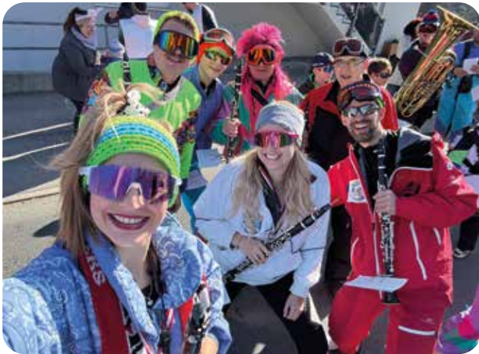
Klarinetten-Register im Apres-Ski Fieber

Bereits am 2. März stürzte sich die Bundesmusikkapelle Angath, nach 10 Jahren Abwesenheit, wieder in das bunte Faschingstreiben - beim Maskenumzug in Niederbreitenbach. Bei herrlichem Wetter und mit „Apres-Ski“- Hits im Gepäck, sorgte die BMK Angath als Skilehrer verkleidet für beste Stimmung. Als besonderes Highlight durften auch alle Jungmusiker in Ausbildung am Umzug teilnehmen.