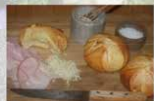
Rezept und Fotos: Ing. Judith Marlene

Alternativ lässt sich der Anis mit 100 ml Weißwein anstelle von Wasser aufkochen.