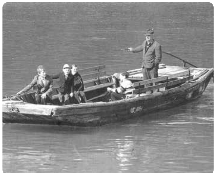
Die Überfuhr, einst wichtiges Verkehrsmittel